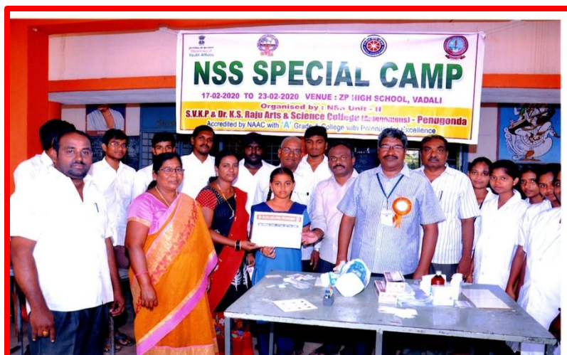
Distribution of Blood Grouping Cards