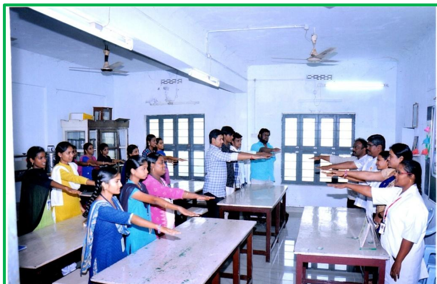
Oath by Students