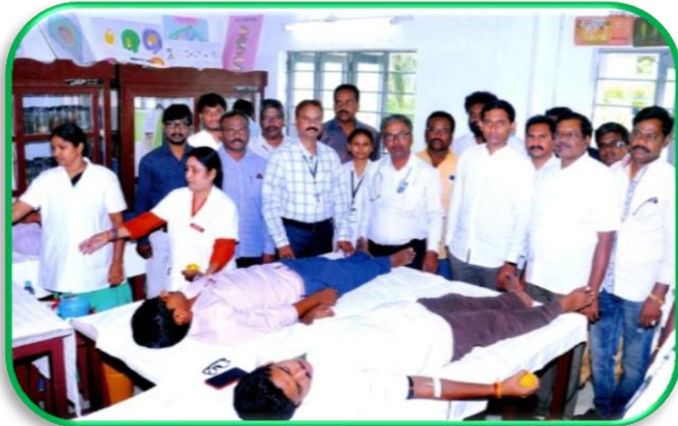
Blood Donation by Volunteers